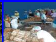
SEBSA (Socio- económicos)