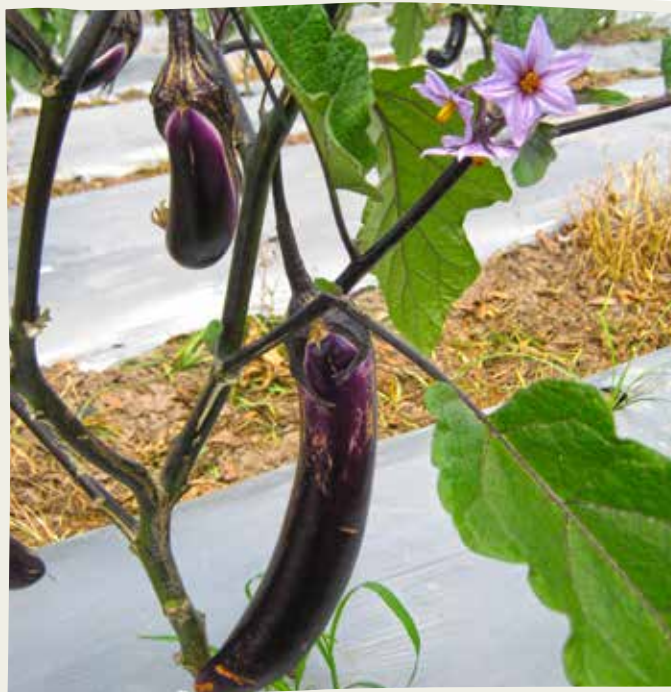
Planta de berenjena

Como en cualquier otro cultivo, los productores se enfrentan con desafíos durante el mantenimiento de la planta, siendo uno de los más importantes el control de la bacteria Ralstonia solanacearum , causante de la enfermedad conocida como marchitez bacteriana, que no solo afecta a la berenjena, sino también a los cultivos de papa, tomate y chile.