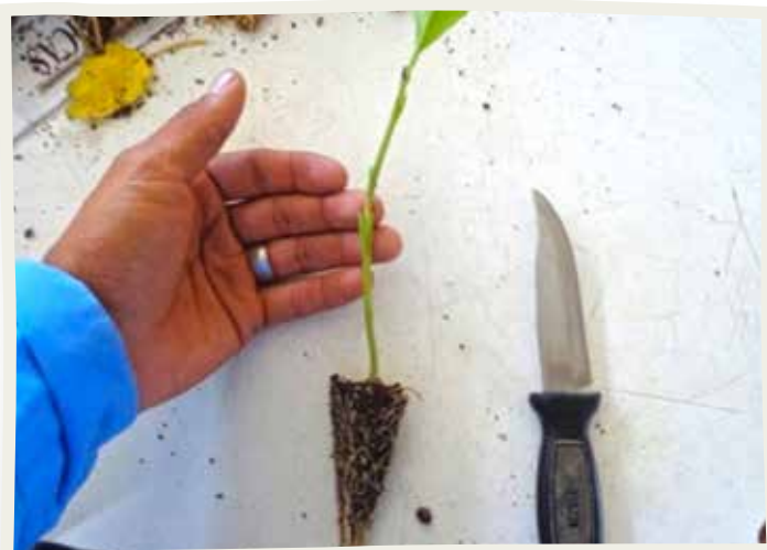
Injerto de berenjena recién hecho.

Los síntomas de plantas afectadas por marchitez iniciaron a los 98 días después del trasplante (ddt) tal como se muestra en el cuadro 1. En total se registraron siete lecturas de mortalidad de plantas a lo largo del ciclo productivo. En todas las lecturas, la mortalidad más elevada fue registrada por el testigo (plantas sin injertar) cuyos valores oscilaron entre 5.1 % a los 98 ddt y 91.1 % a los 157 ddt. Los porcentajes de mortalidad fueron aumentando con el tiempo en todos los tratamientos evaluados.