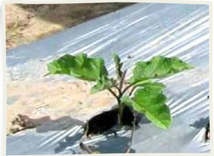
Planta injertada sembrada en el campo.

Como tratamientos se utilizaron cinco cultivares provenientes del AVRDC y como testigo el cultivar comercial de berenjena. Se usó el diseño de bloques completos al azar con cuatro repeticiones por tratamiento. Las variables evaluadas fueron mortalidad de plantas (frecuencia semanal a partir del inicio de la cosecha), rendimiento total y comercial y el descarte incluyendo los diferentes motivos. Los datos fueron analizados mediante análisis de varianza y después las medias fueron separadas mediante la prueba DMS (Diferencia Mínima Significativa).