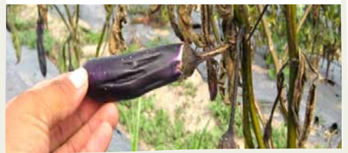
Muerte de plantas de berenjena causada por marchitez bacteriana.