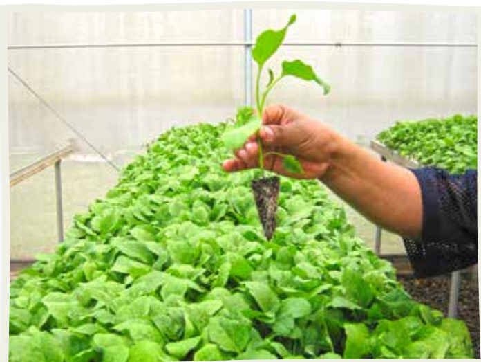
Plántula lista para su trasplante.